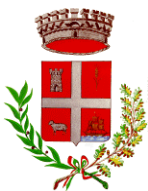
Comune di Villasimius