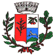
Comune di Burcei